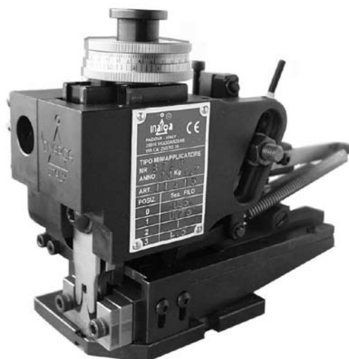
INAR-TOOL F (versione con regolazione micrometrica – micrometric setting)